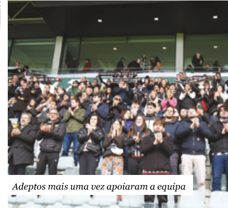
Adeptos mais uma vez apoiaram a equipa

O clube poveiro está apenas a 3 pontos do 2º lugar, ocupado pelo Sporting B, quando ainda faltam disputar 9 jornadas para concluir a fase de campeão.