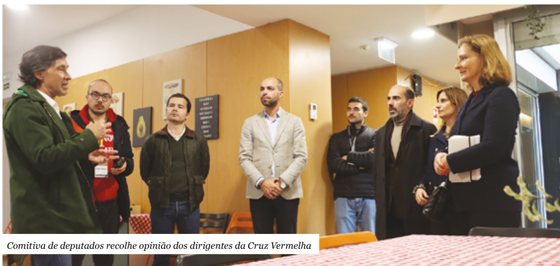
Comitiva de deputados recolhe opinião dos dirigentes da Cruz Vermelha

dições, recursos humanos, técnicos e muitas vezes logísticos, adequados”, contou a deputada do PSD.