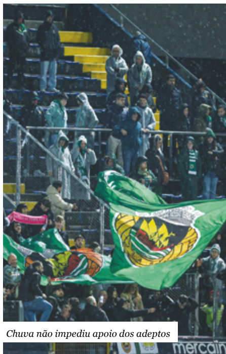
Chuva não impediu apoio dos adeptos

Depois deste desaire na I Liga, o Rio Ave ocupa o 10º lugar com 29 pontos, e no próximo domingo, 16 de março, recebe o Benfica, desafio com início marcado para as 18 horas.