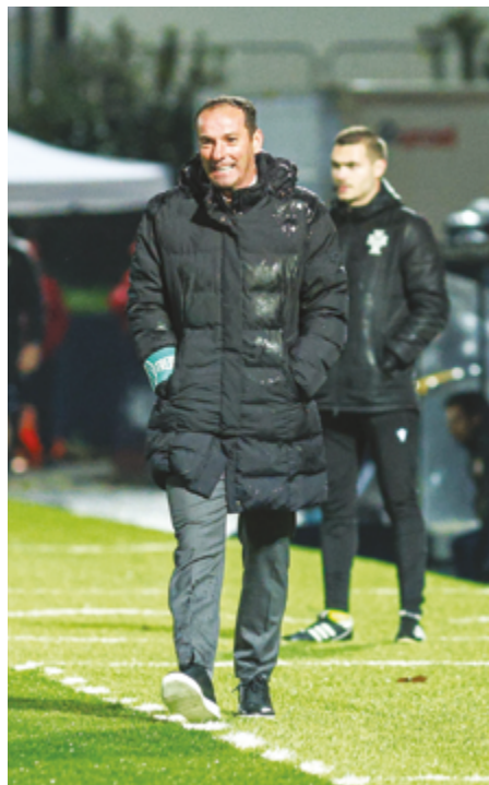
RIO AVE FC