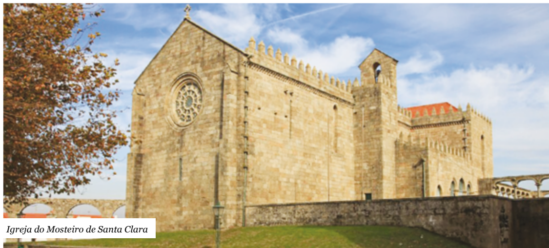
Igreja do Mosteiro de Santa Clara

A Câmara Municipal de Vila do Conde prepara-se para reforçar a prevenção do património do concelho com o investimento na requalificação do Convento de Santa Clara, a igreja da Matriz de Vila do Conde e a igreja da Matriz de Azurara