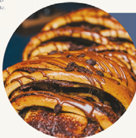
BOLO REI Nutella