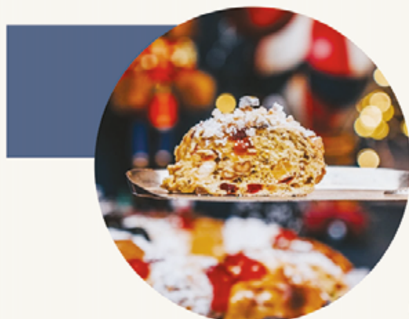
BOLO REI Tradicional

Garanta já o seu pedido e celebre com o sabor único que só o Bolos do Folheta pode oferecer. Entre em contato pelas redes sociais e faça parte da nossa tradição natalina!