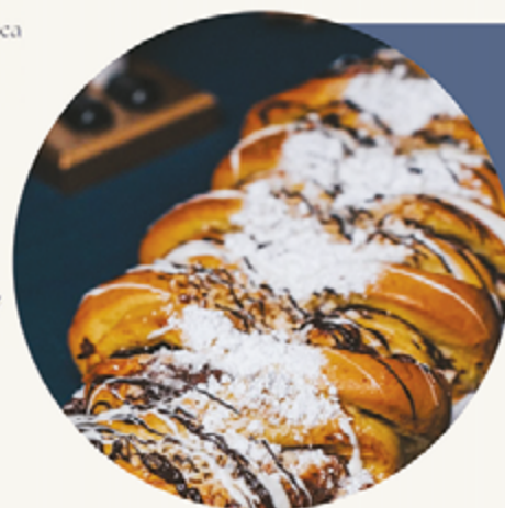
BOLO REI Chocolate