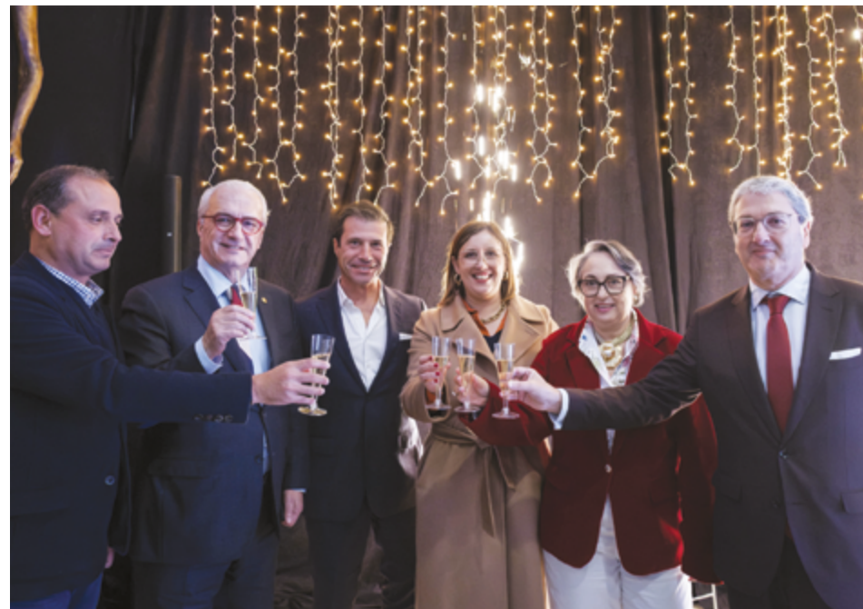
CMVP/JOSÉ CARLOS MARQUES