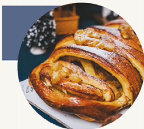
BOLO REI Maçã e Canela

Brioche fôfo com toque folhado, recheado com maçã e canela numa combinação aromática e reconfortante. 19€ KG