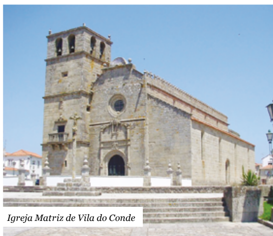
Igreja Matriz de Vila do Conde

O município está a avançar com um projeto ambicioso de requalificação, envolvendo três monumentos históricos do concelho, o Convento de Santa Clara, a igreja da Matriz de Vila do Conde e a igreja da Matriz de Azurara. As intervenções, já em curso, contam com financiamento do Plano de Recuperação e Resiliência (PRR), do Fundo de Salvaguarda do Património Cultural e do Programa Norte 2030.