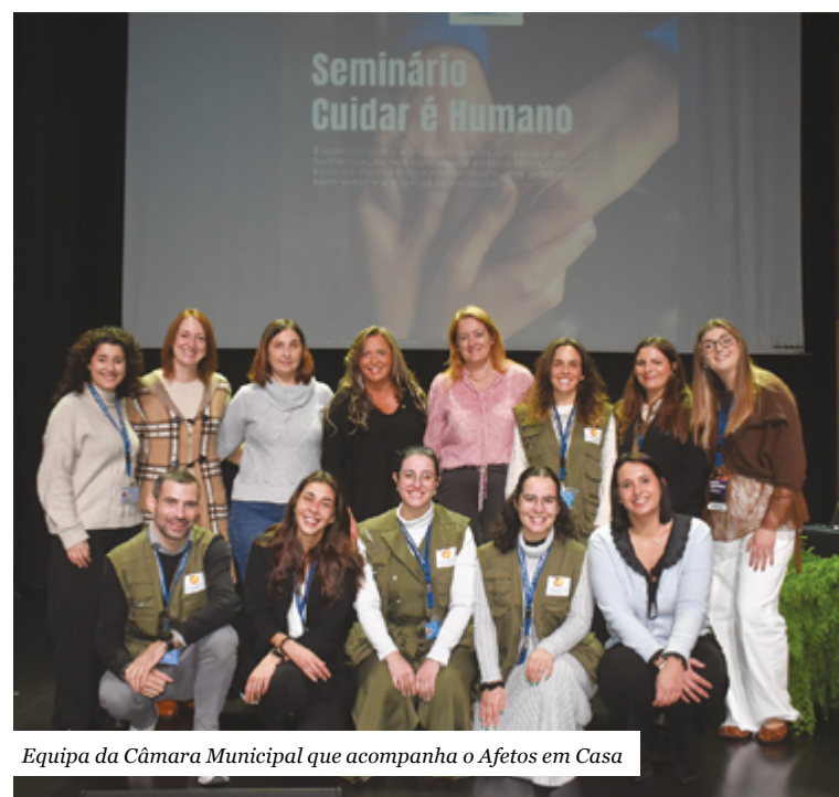
Equipa da Câmara Municipal que acompanha o Afetos em Casa