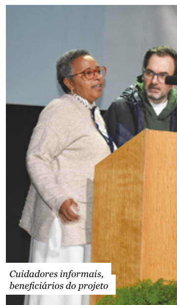
Cuidadores informais, beneficiários do projeto