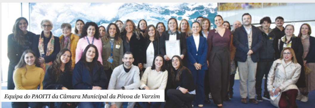
Equipa do PAOITI da Câmara Municipal da Póvoa de Varzim

Esta sexta-feira, 5 de dezembro, o Auditório Municipal será palco da apresentação de resultados e do Guia de Práticas Promissoras