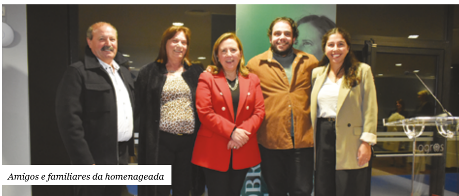
Amigos e familiares da homenageada