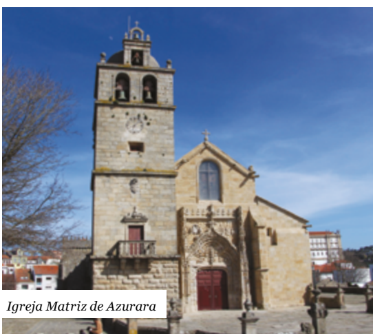
Igreja Matriz de Azurara