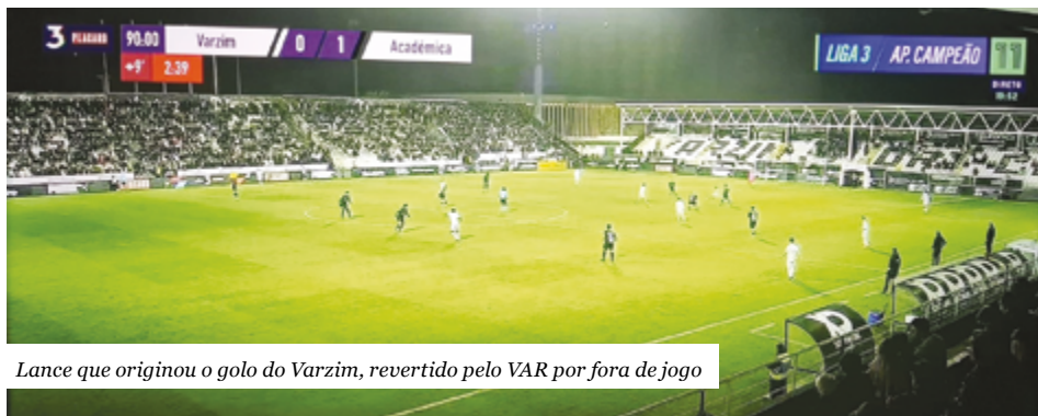
Lance que originou o golo do Varzim, revertido pelo VAR por fora de jogo