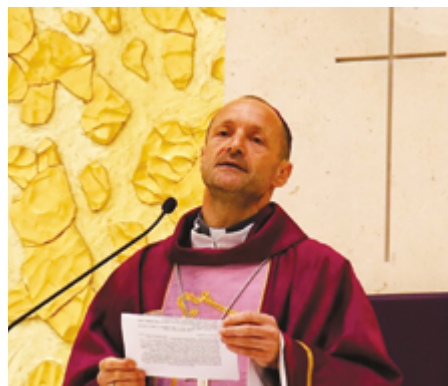
SANTUÁRIO DE FÁTIMA

O bispo poveiro classificou o diálogo entre Jesus e a samaritana como “profundo e transformador”, contrapondo-o às interações superficiais que marcam o quotidiano, sobretudo nos ambientes digitais e nas redes sociais. Para o prelado, a verdadeira relação nasce do encontro presencial, do