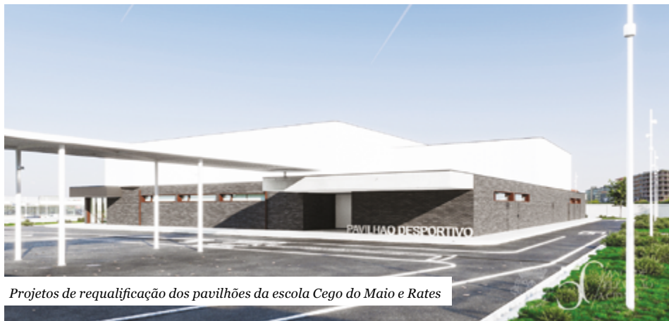
Projetos de requalificação dos pavilhões da escola Cego do Maio e Rates

O Executivo da Câmara Municipal da Póvoa de Varzim aprovou na reunião de terça-feira, por unanimidade, a contratação de um empréstimo de cinco milhões de euros destinado a acelerar um conjunto de investimentos considerados prioritários, com destaque para a requalificação de pavilhões escolares e para várias obras de urbanização em curso no concelho