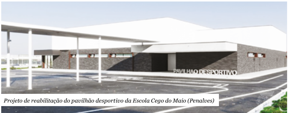
Projeto de reabilitação do pavilhão desportivo da Escola Cego do Maio (Penalves)