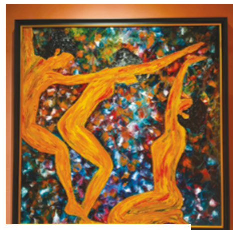
A obra apresentada, ‘Everything I Want’

Pequim, a participação na Bienal Internacional de Arte de Gaia, e foi artista convidada na BIALE – Bienal Internacional de Arte do Alentejo.