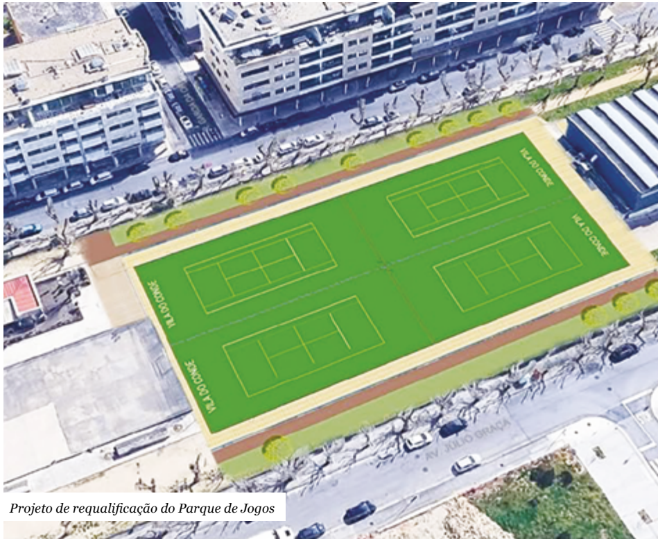
Projeto de requalificação do Parque de Jogos

Inclui também a realocação cuidada dos elementos patrimoniais, como o Cruzeiro e o busto, preservando a identidade do local. A circulação automóvel será reorganizada e será criada uma zona de estacionamento estruturado. Mantém-se, igualmente, todas as condições necessárias para a realização das festas tradicionais da freguesia, uma exigência expressa pela comunidade.