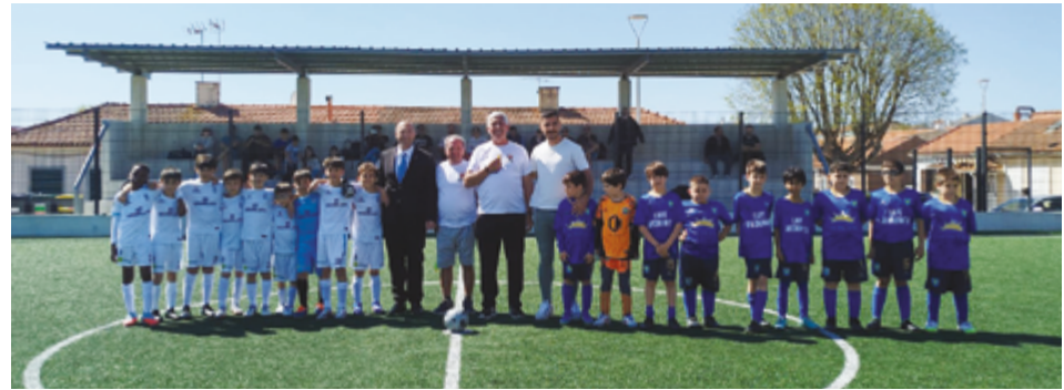
JUNTA DE FREGUESIA DA PÓVOA DE VARZIM