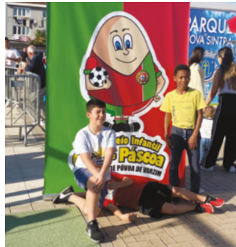
JUNTA DE FREGUESIA DA PÓVOA DE VARZIM