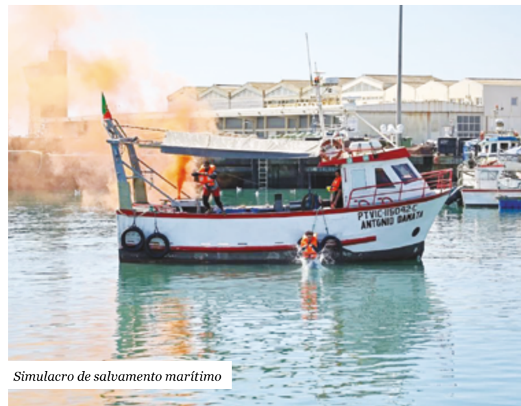
Simulacro de salvamento marítimo