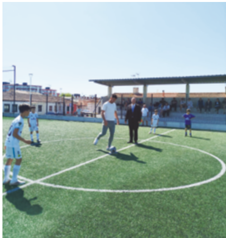
JUNTA DE FREGUESIA DA PÓVOA DE VARZIM

Com as cores de Portugal a darem identidade à edição deste ano, o Torneio Ovo de Páscoa arrancou com energia em Nova Sintra e regressa já na sexta-feira, 3 de abril, para a segunda fase, culminando no sábado, 4 de abril, com as grandes finais.