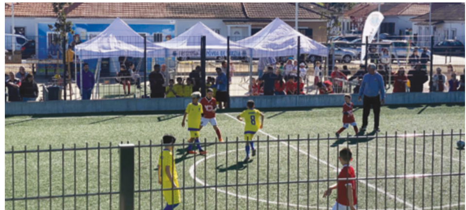
JUNTA DE FREGUESIA DA PÓVOA DE VARZIM