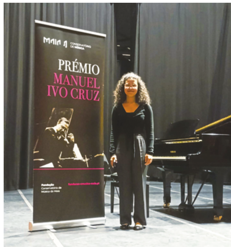
ESCOLA DE MÚSICA DA PÓVOA DE VARZIM

A conquista agora alcançada no Concurso Internacional Maestro Manuel Ivo Cruz reforça o papel da EMPV na formação de jovens músicos e confirma o mérito de um percurso que alia talento, estudo contínuo e acompanhamento pedagógico de qualidade.