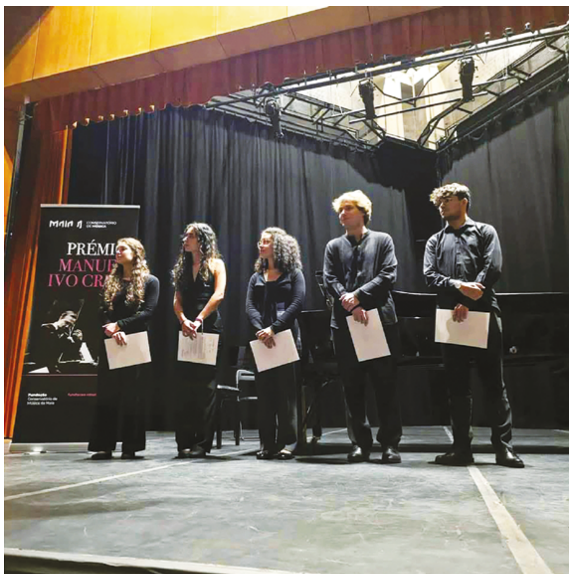
ESCOLA DE MÚSICA DA PÓVOA DE VARZIM