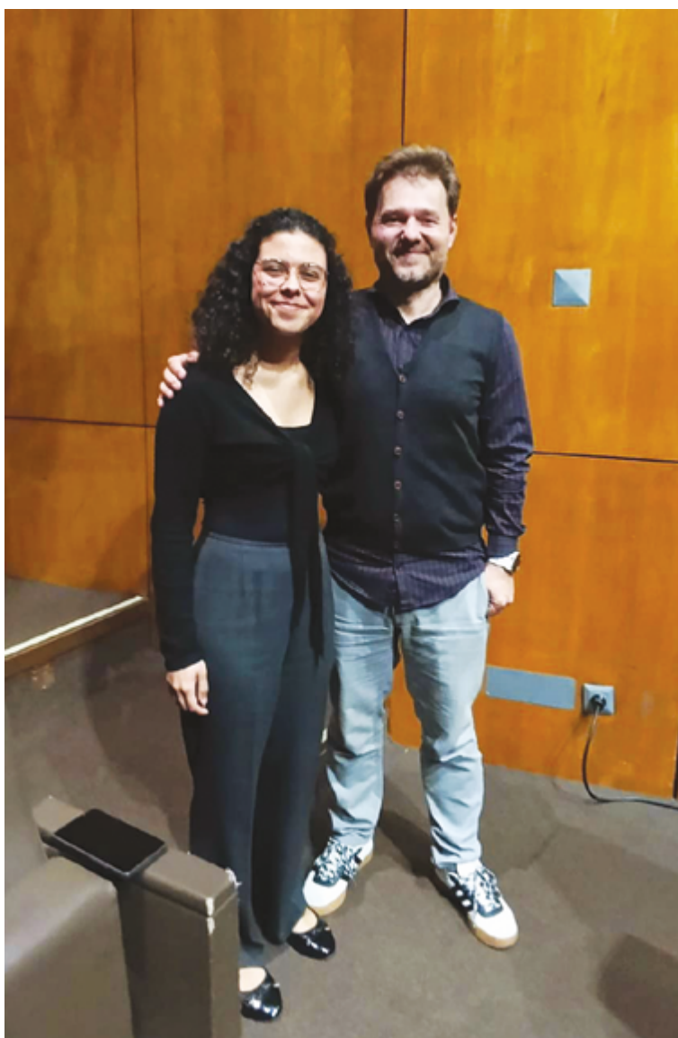
ESCOLA DE MÚSICA DA PÓVOA DE VARZIM