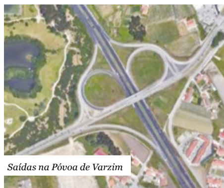
Saídas na Póvoa de Varzim