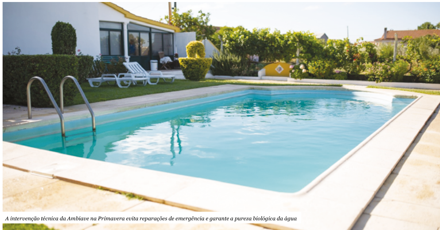
A intervenção técnica da Ambiave na Primavera evita reparações de emergência e garante a pureza biológica da água

• Eficiência Mecânica: a revisão das bombas, filtros e sistemas de filtração garante que o consumo