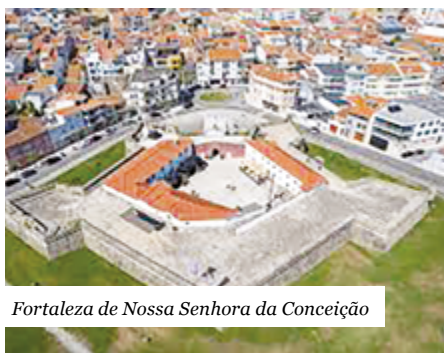
Fortaleza de Nossa Senhora da Conceição