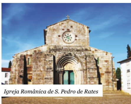
Igreja Românica de S. Pedro de Rates