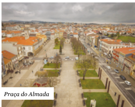
Praça do Almada