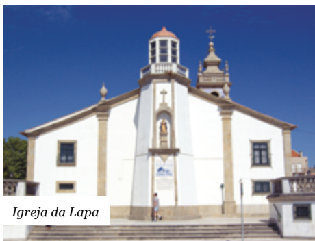
Igreja da Lapa