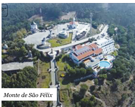
Monte de São Félix