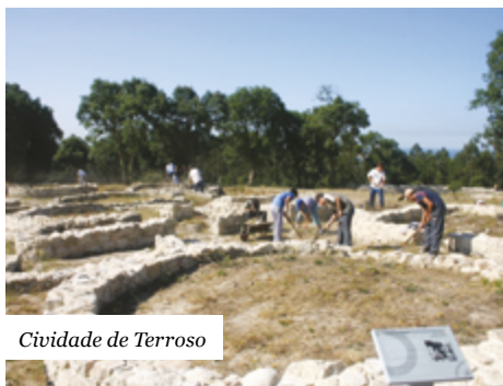
Cividade de Terroso